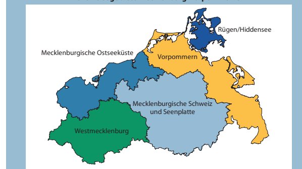
Die Reisegebiete Mecklenburg-Vorpommerns